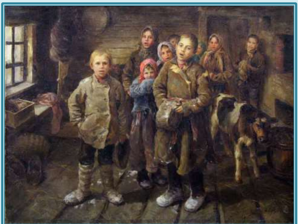
Ф.В. Сычков «Христославы»

Вечно будем Бога славить За такой день торжества! Разрешите Вас поздравить С Днем Христова Рождества! Много лета вам желаем, Много, много, много лет.